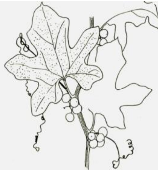
LA BRYONE : Bryonia dioica