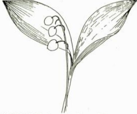
LE MUGUET : Convallaria majalis