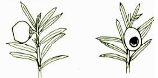
L'IF : Taxus baccata