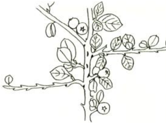
LE COTONEASTER : Cotoneaster horizontalis