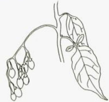
LA MORELLE DOUCE-AMERE : Solanum dulcamara