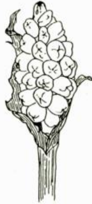
L'ARUM TACHETE : Arum maculatum