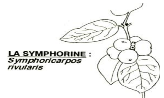
LA SYMPHORINE : Symphoricarpos rivularis